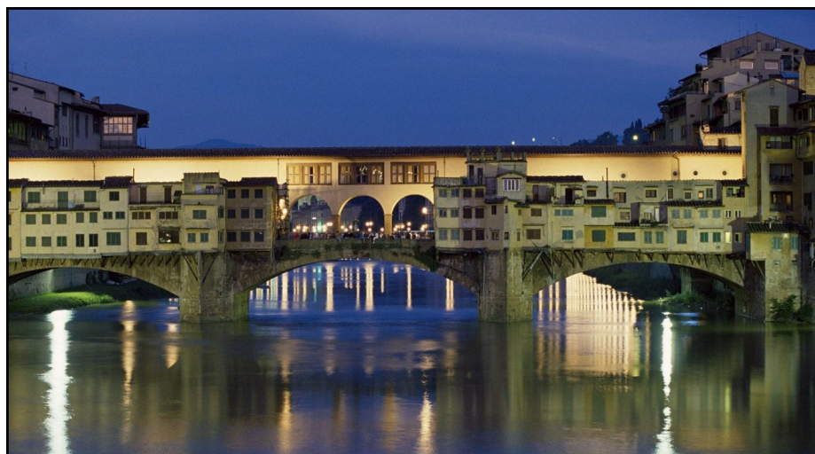
Ponte-Vecchio de Florence

Voyage en avion avec un départ le jeudi 20 Mars au matin et retour le dimanche soir 23 mars (accompagnement en autocar depuis le parking de l'AJME à Maurepas). Votre chambre est réservée à l'hôtel Arizona, un ancien palais rénové et confortable. Repas cachet au restaurant « Ruth ».