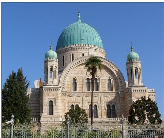
Synagogue de Florence